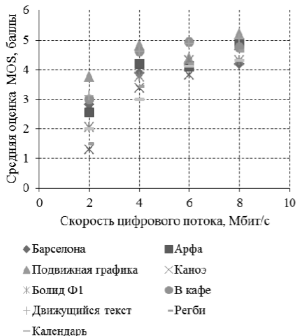
Рис. 2. Результаты субъективного измерения качества

Поскольку существует большое количество объективных методов измерения качества видеоизображений, целесообразно выяснить, какой из методов дает оценку, максимально приближенную к оценке, отвечающей восприятию человека. Для решения этой задачи введен критерий точности на основе коэффициента линейной корреляции Пирсона r между предвиденным значением объективной метрики и реальной субъективной оценкой.