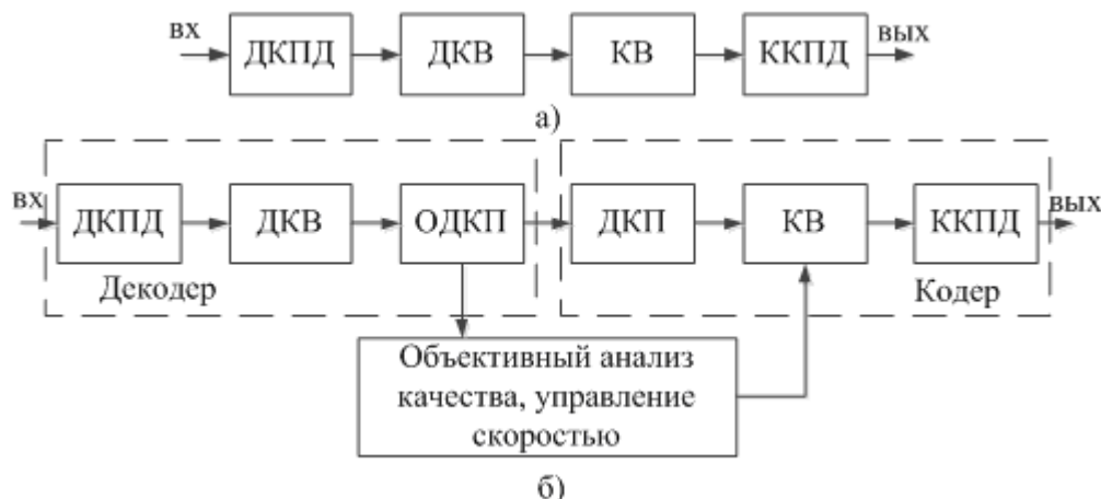
Рис. 1. Транскодер:

а – без обратной связи; б – с обратной связью (ДКПД – декодер кода переменной длины, ККПД – кодер кода переменной длины, ДКВ – деквантователь, КВ – квантователь, ОДКП – обратное ДКП)