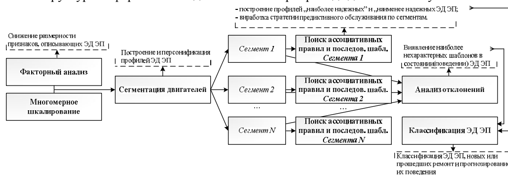
Рис. 3. Мета-модель взаимосвязи задач интеллектуального анализа и прогнозирования состояния ЭД ЭП

Главной идеей, которая положена в основу концепции мониторинга, является следующая: рядом с