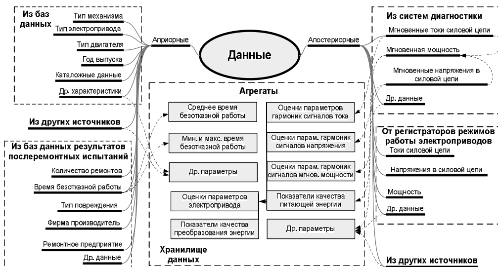
Рис. 2. Структура информативных данных об электроприводе для интеллектуального анализа

Наряду с разработкой и реализацией важных типичных этапов Data Mining - консолидацией данных, реализацией ETL-процесса, трансформацией, очисткой и загрузкой в хранилище данных [5,6] - актуальным является вопрос синтеза структуры взаимодействия задач интеллектуального анализа на различных стадиях моделирования, что должно составлять основу так называемого аналитического сценария (рис.3).