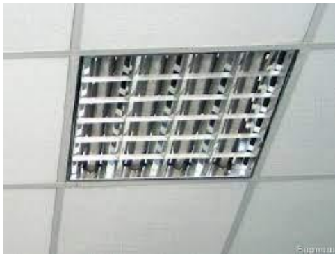
Рис. 1. Растровий світильник вбудований в підвісну стелю "Армстронг"

Такі світильники зазвичай комплектуються чотирма люмінесцентними лампами Т8 довжиною 600 мм (цоколь G13) потужністю 18 Вт. Світловий потік такої лампи може становити 1350 лм [10], сумарний світловий потік від 4-х ламп відповідно 5400 лм. Однак, не весь світловий потік йде за призначенням, істотна його частина втрачається в самому світильнику. Наприклад, за каталожними даними компанії "Світлові технології" у розглянутого світильника із дзеркальною екрануючою решіткою ККД становить лише 55% [11], в результаті чого світловий потік світильника складе всього 0,55 \cdot 4 \cdot 1350 = 2970 лм.