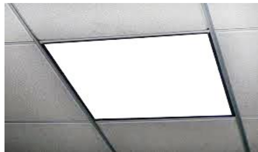
Рис. 2. Світлодіодна панель для стель

Альтернативою в питанні заміни люмінесцентних ламп є застосування замість світильників з люмінесцентними лампами світлодіодних панелей з матовим або трапецієподібним розсіювачами (Рис. 2).