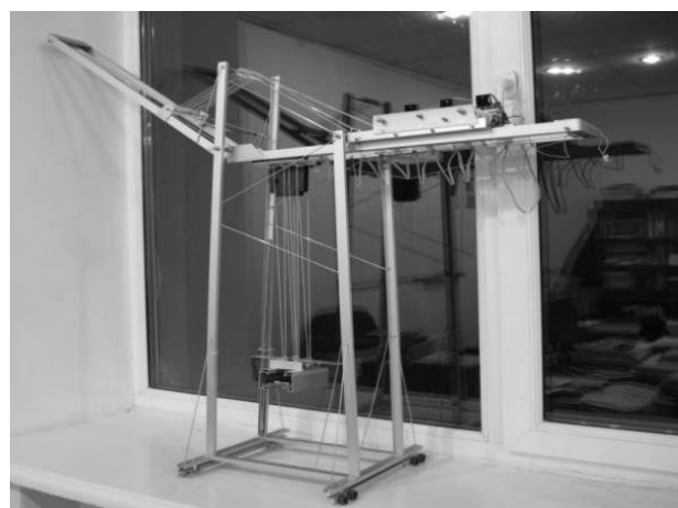
Рис. 2. Макет контейнерного перегружателя

В основу электромеханической части положены шаговые микродвигатели, драйверы управления шаговыми двигателями и однокристалльный микроконтроллер. Шаговые двигатели обладают рядом качеств, упрощающих конструкцию электромеханической части крана: большой крутящий момент, простота в управлении, точное регулирование средней скорости при повороте на один шаг за заданное время. Позиционирование – поворот вала двигателя на n -ое количество дискрет (шагов) – обеспечивается конструкцией ротора без использования обратной связи, что в любой момент времени позволяет определять положение каждого механизма при отсчете от некоторой нулевой точки.