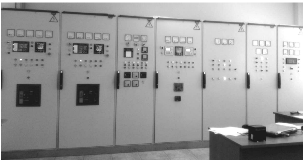
Рис. 1. Общий вид 1 – 7 секций главного распределительного щита

Секции 8 – 10 группы потребителей № 2, а также секции 11 – 14 высоковольтных потребителей (рис. 3) расположены в другом помещении тренажерного комплекса. Секции групп потребителей с одной стороны представляют собой автоматизированные электро-механические системы отдельных судовых механизмов с их типовой нагрузкой, с другой – отдельные судовые комплексы или, например, отдельную лабораторию.