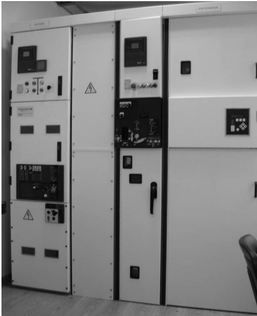
Рис. 3. Высоковольтные секции главного распределительного щита