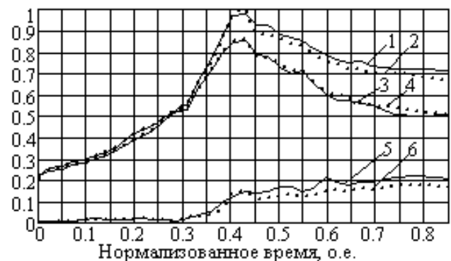
Рис. 2. Изменение мощности ЭТКГ, ПГ и потерь при графитации заготовок электродов: (1), (2) – активная мощность ЭТКГ ДР и ОР; (3), (4) – мощность ПГ ДР и ОР; (5), (6) – потери в ЭТКГ ДР и ОР

При управлении мощностью графитации со стороны ВН ПГ стремятся обеспечить коэффициент мощности не ниже 0,98. Однако при этом не выполняются условия резонанса токов в параллельных контурах ПП и КУ. Как следствие, ток КУ на 24 – 47 % превышает оптимальное для текущего момента времени значение, а ток графитации снижается на 7 – 8 % (рис. 1).