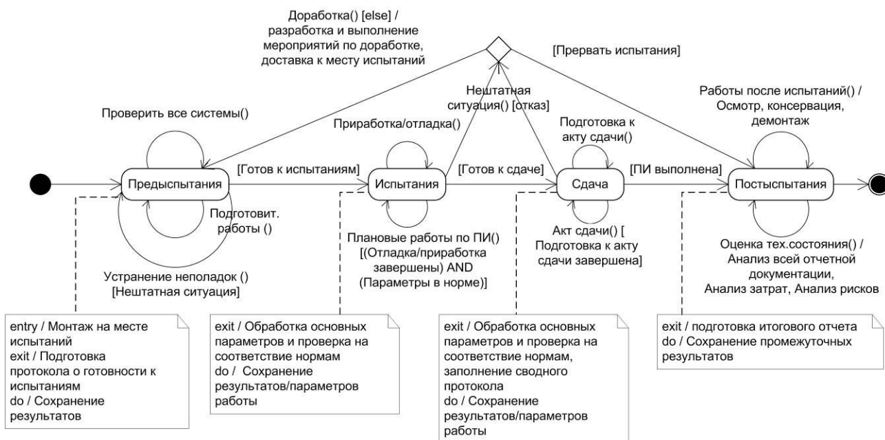
Рис. 3. Диаграмма вложенных состояний составного состояния «На стенде»

При конкретизации подмножества условий U_{\square} было отмечено, что для состояний «Испытания» и «Сдача» данное множество будет содержать допустимые значения параметров работы объекта испытаний. Тогда как подмножество Y_{\square} , Y_{\square} \in Y , фактические значения параметров работы, получаемые в ходе испытаний. Поэтому y_{\square_i} \in u_{\square_i} будет свидетельствовать об успешном ведении процесса испытаний и служить сигналом для смены состояния.