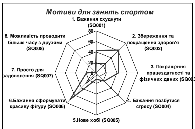
Рис. 3. Мотиви для занять спортом

Слід також відмітити, що дані опитування респондентів щодо суб'єктивного оцінювання стану власного здоров'я не завжди збігалися з об'єктивними результатами вимірювання їх фізіологічних показників, наприклад, відхилення відмічались у спортсменів (підвищений артеріальний тиск).