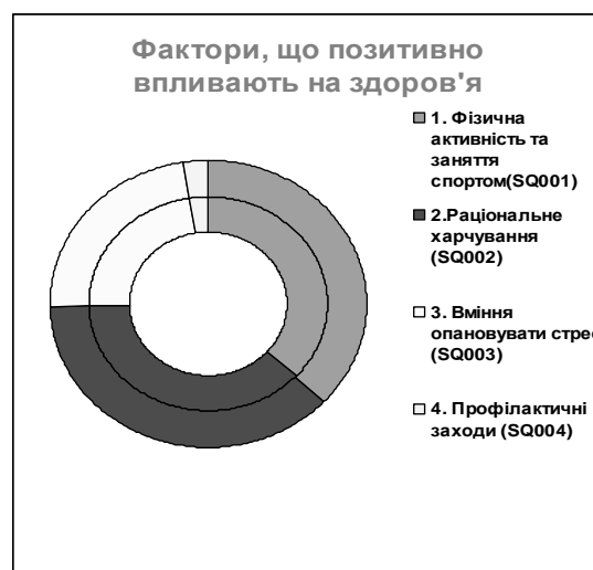
Рис. 2. Фактори, що позитивно впливають на стан здоров'я

На рисунках 2 та 3 наведено графічне відображення результатів анкетування щодо питань збереження та покращення здоров'я. Слід відмітити, що профілактичним заходам студенти приділяють мало уваги.