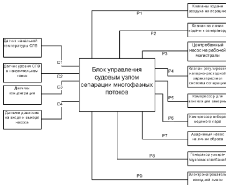
Рис. 1. Схема автоматизации управления судовым сепаратором многофазных потоков: D1...4 – Цифровые данные измерительных датчиков; P1...9 – Импульсные сигналы управления исполнительных устройств